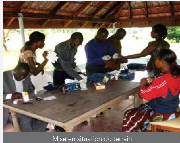
Mise en situation du terrain