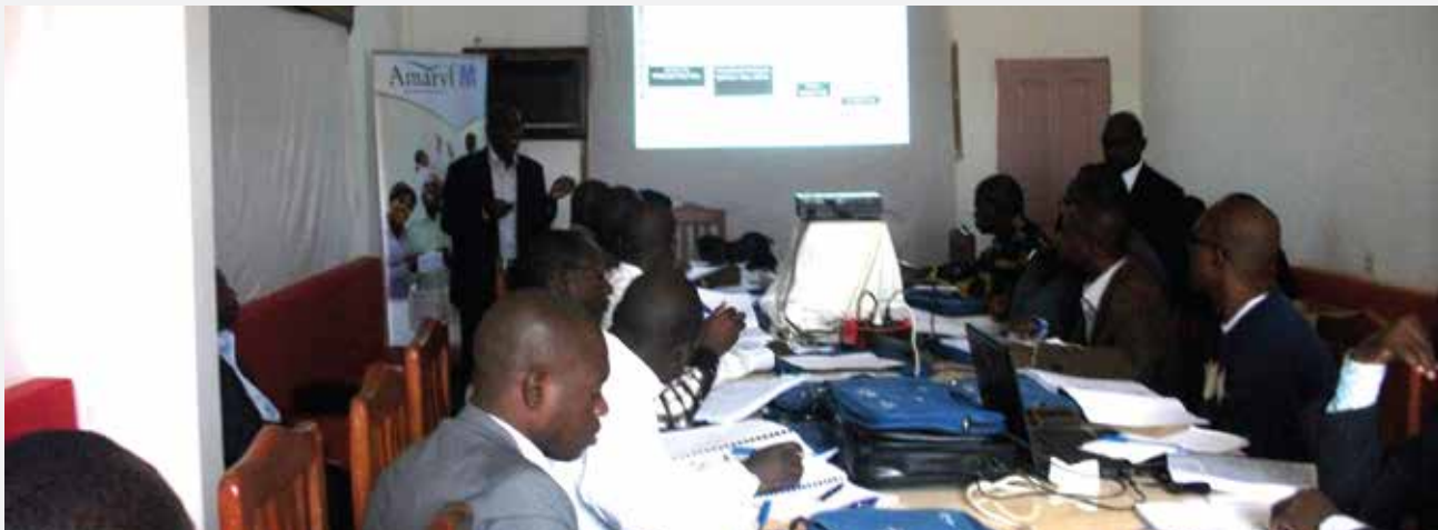
Formation de médecins généralistes à la prise en charge du diabète à ABIDJAN et à l'intérieur du pays