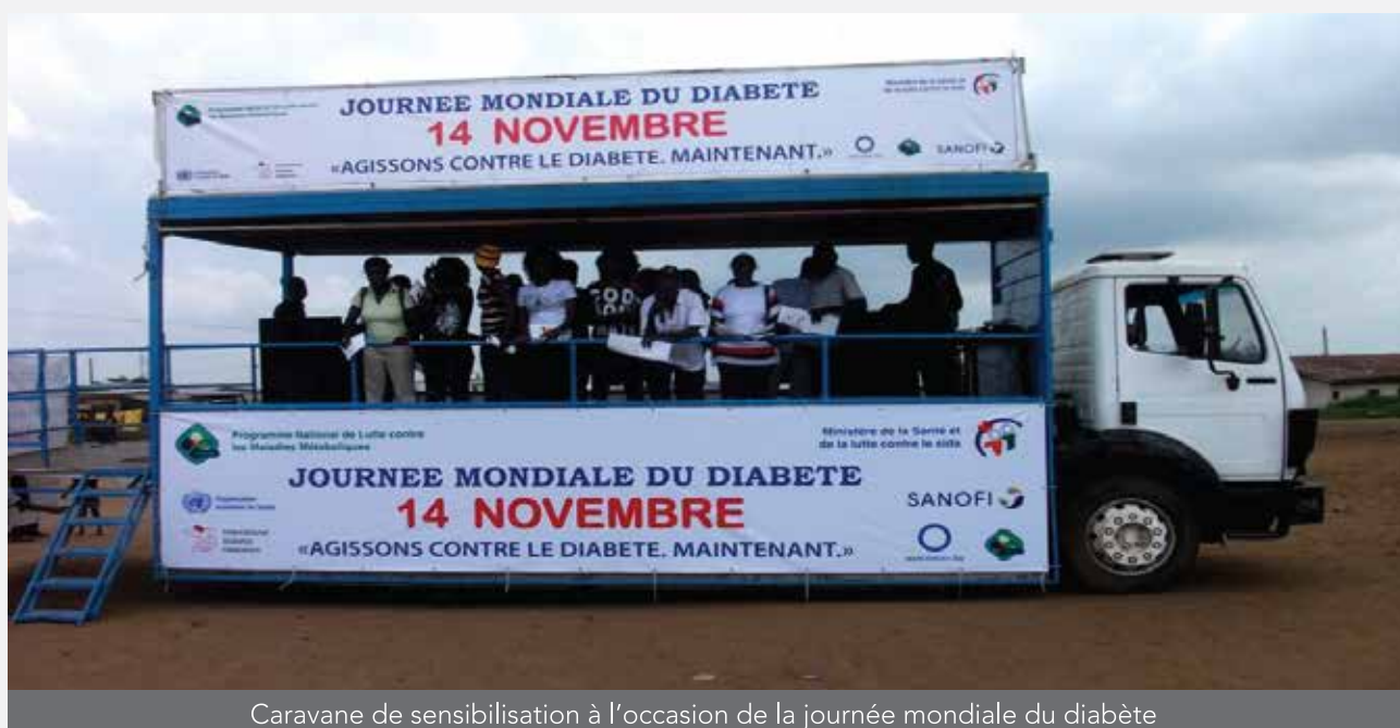
Caravane de sensibilisation à l'occasion de la journée mondiale du diabète